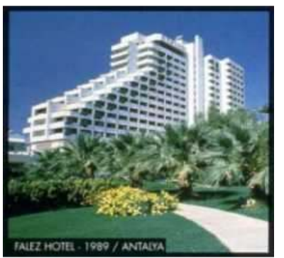
FALEZ HOTEL (1989) & CASINO (1991) – ANTALYA 380 odalı 5 yıldızlı otelin ve casinusunun cctv sistemi