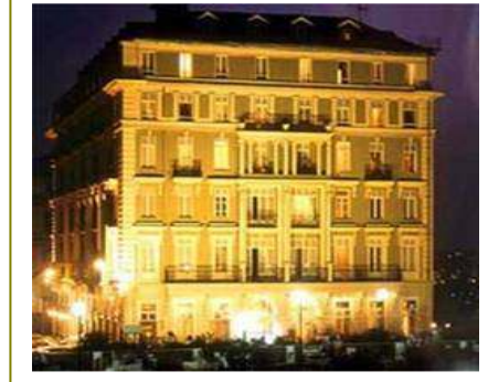
PERA PALACE HOTEL (1997) – İSTANBUL 145 odalı otelin özel bir cctv sistemi.