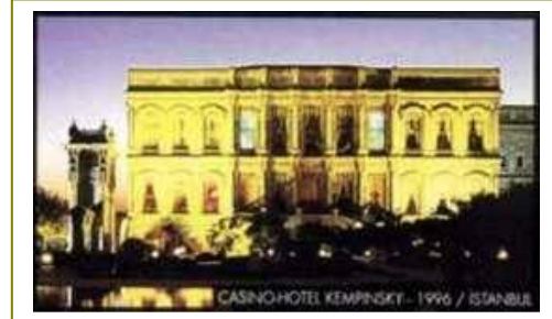
CASINO HOTEL KEMPINSKY (1996) – İSTANBUL Casinodaki tüm masaları, oyun makinelerini ve vezneleri çok ayrıntılı şekilde denetleyen ve kayıt eden çok geniş kapsamlı cctv sistemi.