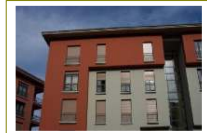
SARI KONAKLAR SİTESİ (1995) / İSTANBUL 23 blok 250 lüks daireli yerleşimin çevre denetimini yapan ve çocuk parklarının evlerden izlenmesini sağlayan cctv sistemi